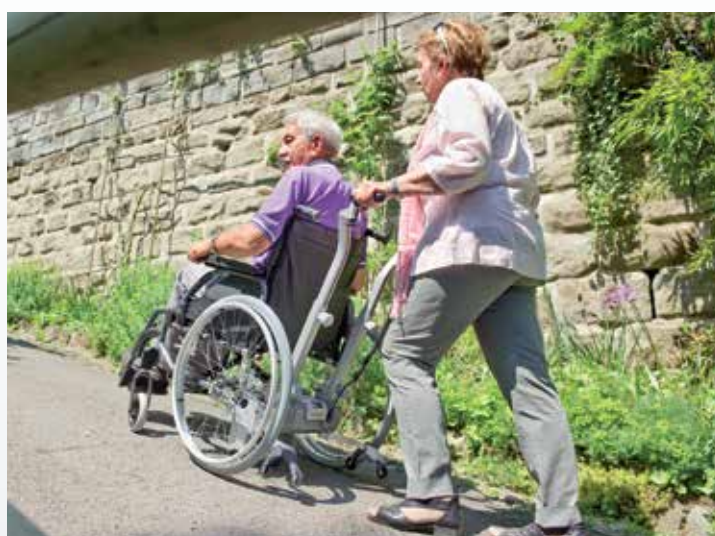
Maîtriser une montée sans difficultés.