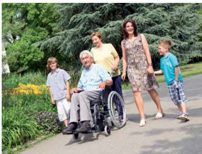
Sécurité et confort dans une descente.

Nous vous assurons de la mobilité. Peu importe la situation.