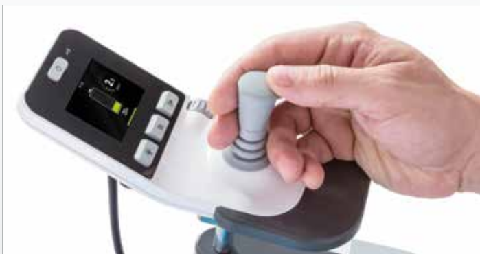
Informatief kleuren display met gebruiksvriendelijke bedieningen