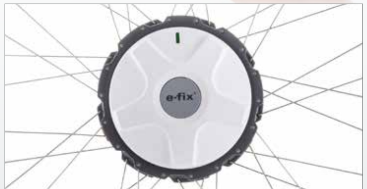
Compact, stil en krachtig: de e-fix rijwielen