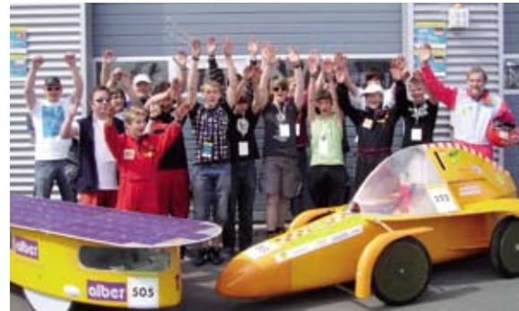
Das erfolgreiche Team mit den zwei Fahrzeugen.