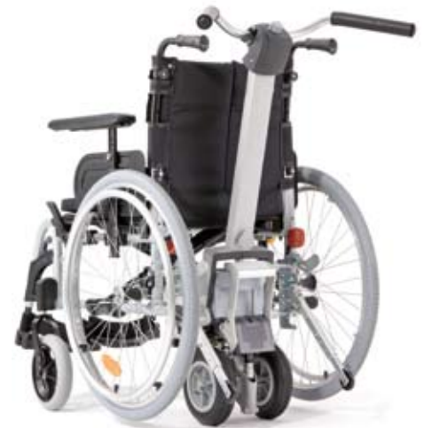
Wirtschaftlichkeit im Fokus – viamobil eco V14.

Das neue viamobil eco V14 ist seit dem 20.11.2006 über den Sanitätsfachhandel lieferbar. Das bewährte viamobil V15 wurde hierbei aufgerüstet. Die neue verstärkte Version erlaubt nun ein zulässiges Gesamtgewicht von 210 kg.