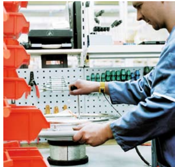
Alber Services geben dem Nutzer Sicherheit.

Die Mobilität der Versicherten gewährleistet das Alber Service Center mit dem branchenweit einzigartigen