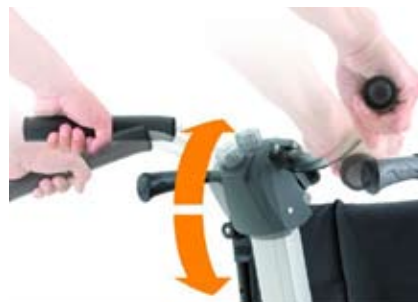
Patentiertes Bedienkonzept ErgoDrive für ermüdungsfreies Rollstuhlschieben.

an. Die Bedienperson muss nur noch die Richtung vorgeben und kann so ermüdungsfrei auch längere Spaziergänge mit dem Rollstuhlfahrer unternehmen. Diese einfache und ergonomisch optimierte Handhabung hat der TÜV Produktservice bereits mit dem Prädikat „Einfach zu bedienen“ ausgezeichnet.