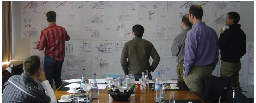
Das Alber-Entwicklungsteam bei der Arbeit.

Ziel der Forschungs- und Entwicklungsanstrengungen bei Alber ist die Qualitätsführerschaft. Technologien, die nicht zu den eigenen Kernkompetenzen gehören, entwickelt Alber daher gemeinsam mit externen Kooperationspartnern. Beim Adventure waren beispielsweise Fahrwerks- und Sitzspezialisten sowie Designer mit im Boot. Wenn der erste Prototyp fertig ist, versuchen die Entwickler so schnell wie möglich, Marktreife zu erlangen. Jetzt wird gefeilt, getüfelt,