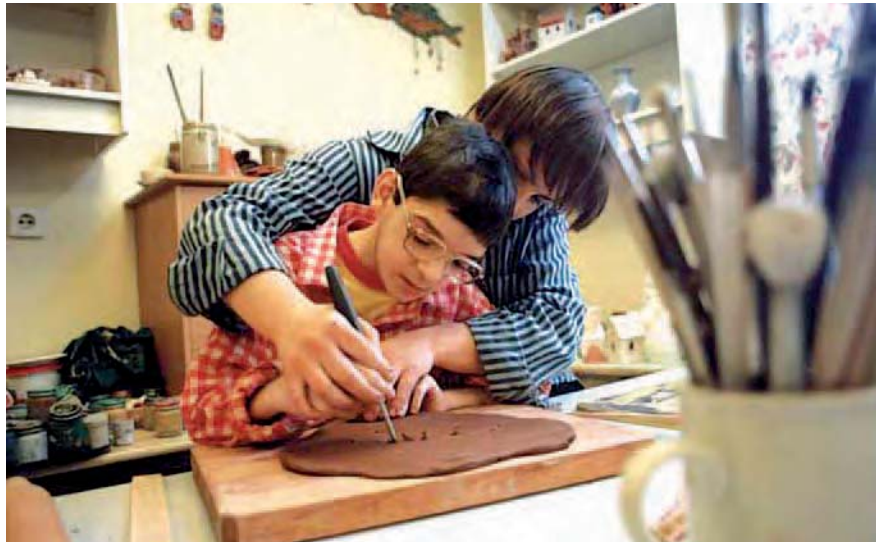
Individuelle Betreuung der behinderten Kinder im Heilpädagogischen Zentrum in Moskau.

Im Club Handicap in Albstadt gestalten Menschen mit und ohne Behinderung gemeinsam ihre Freizeit. Das Angebot reicht von Aktivitäten wie Schwimmen, Backen oder Inlineskating bis hin zum gemeinsamen Urlaub unter Palmen. Behinderte Menschen erhalten hier die Möglichkeit, aktiv zu sein und die eigene Persönlichkeit zu entfalten. www.club-handicap-albstadt.de