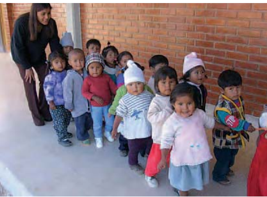
Die Gruppe der Kleinsten im neuen Kindergarten in Ushpa-Ushpa.

Eine Gruppe junger Menschen, die in Russland ein freiwilliges soziales Jahr absolvierte, hat Iwanuschka ins Leben gerufen. Behinderte Menschen leben dort teilweise noch unter unwürdigen Bedingungen und werden oft schon im Säuglingsalter in staatlichen Pflegeheimen untergebracht. Iwanuschka versucht zusammen mit den Pflégern und Eltern Missstände zu beheben und die Selbstständigkeit der Kinder zu fördern. www.iwanuschka.de