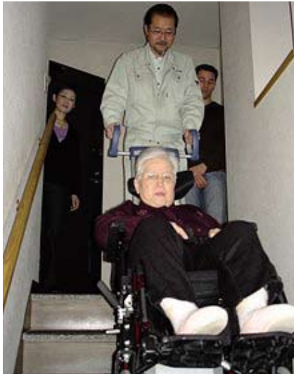
Mitten in Tokio – das scalamobil S30 IQ im Einsatz

Platz ist Mangelware in den Metropolen Japans. Die Treppenhäuser sind häufig so eng, dass der Einbau eines Aufzugs